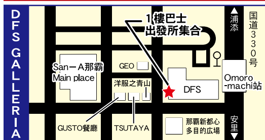
Pallet 久茂地 (日本汽車租賃公司前面)