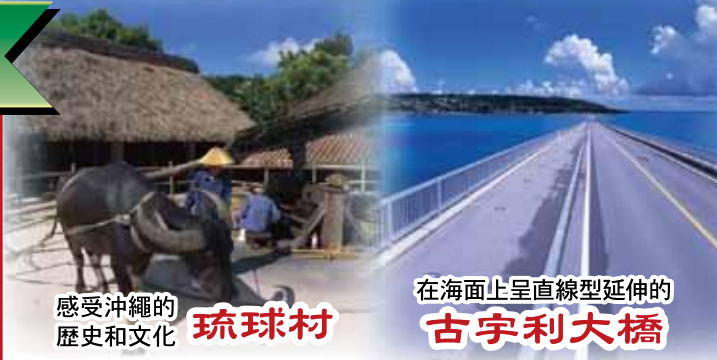
感受沖繩的歷史和文化 琉球村

琉球村 是將遺留在沖繩各地的民家遷移到此、再現當時的生活景象的民俗村。現在利用這些民家做為手工坊、紅型教室、或者是陶器獅子塗漆繪畫教室。